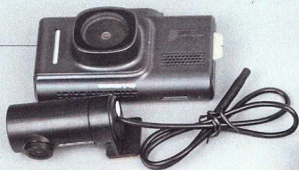
Neoline G-Tech X74