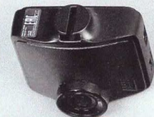
Mio Mivue C380D