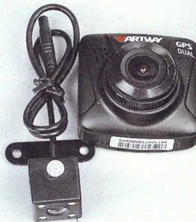
Artway AV-398 GPS Dual