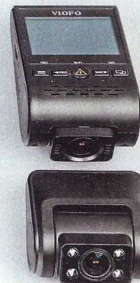
Viofo A129 Duo IR